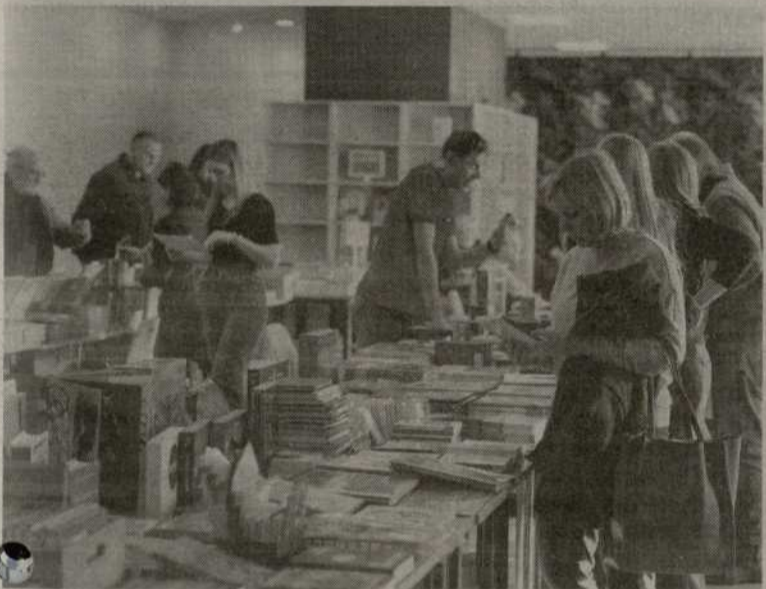
Šiaulių knygų mugėje buvo galima įsigyti įvairių leidinių.