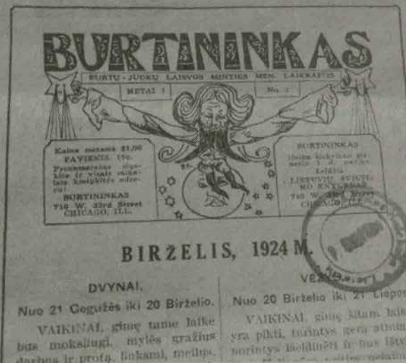
Čikagoje lietuvių leisto burtų-juokų laisvos minties mėnesinio laikraščio „Burtininkas“ 1924 metų birželio numeris.