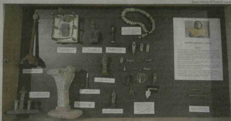
Parodoje eksponuojami miniatiūriniai akmeniniai dirbiniai.

Visiems kepėjams įreikti padėkos raštai ir regioninio parko dovanėlės. O kepė šiemet žmonės iš Žagarės, Joniškio, Daukšų, Stungių, net kraštiečiai iš Mazelių.