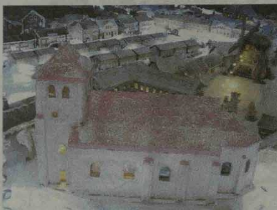
Prieš šimtą metų Žagarė buvo klestintis amatininkų, prekybininkų miestas, turėjęs daugiau kaip dešimt tūkstančių gyventojų.

Šiemet Žagarės regioninio parko dvaro rūmuose apsilankiusiems meduolinė pasaka primins, koks klestintis amatininkų, prekybininkų miestas prieš šimtmetį buvo Žagarė. Maketo centre atgyja miesto aikštė, kurioje anuomet stovėjo dvi „rindos“ – eilės mažų, daugiausia žydams priklausių, parduotuvelių. Aplink aikštę rikiuojasi dar tebesantys ir jau tik nuotraukų vaizduose išlikę pastatai, kuriuose veikė įvairiausia prekyba – ne tik maistu, būtiniausias buities reikmenimis, bet netgi prabangiais išdirbtais kailiais, skrybėlėmis, veikė karčemos, gyveno „tepliorius“ (dailininkas, kuris rūpinosi miesto afišomis, iškabomis – aut. past.), batsiuvys, siuvėjas, vaistus pardavinėjęs net dvi „aptekos“ (vaistinės – aut. past.), o dabar veikia tik viena, buvo įrengtas turima įranga ant-