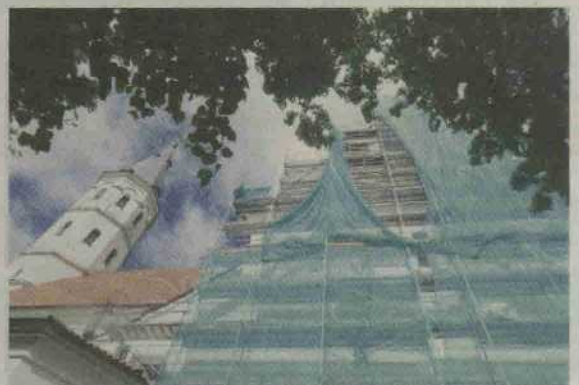
Šiaulių katedra. 2020-06-01.