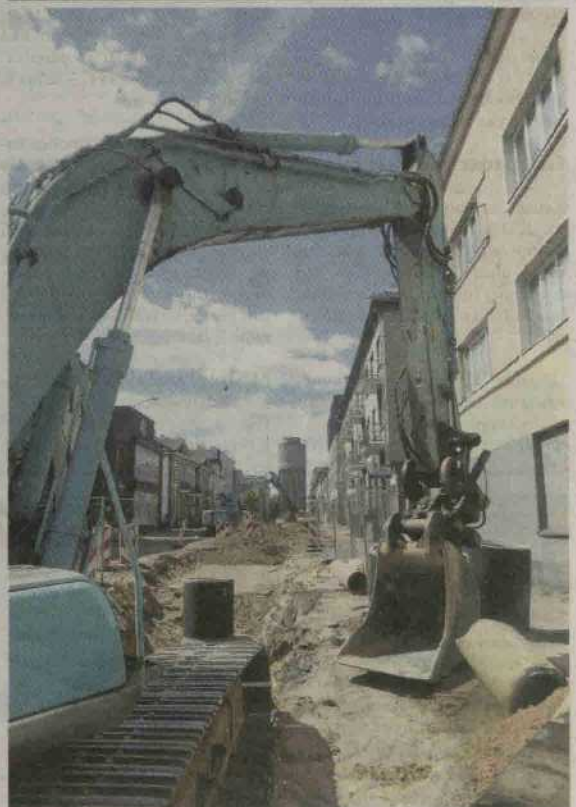
Vasario 16-osios gatvė. 2020-06-01.