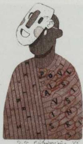
Ramūnas Petrusėvičius. Ofortas, akvatinta, 2025 m.