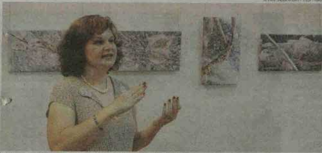
Audronės Grigorjevičienės fotografijų paroda „Ledo poezija“.