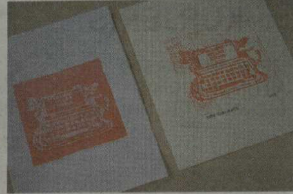
Parodoje pristatyti Šiaulių bendruomenės ir jaunųjų kūrėjų darbai.

Kūrybinių dirbtuvių metu buvo lavinamas jaunimo kūrybiškumas.