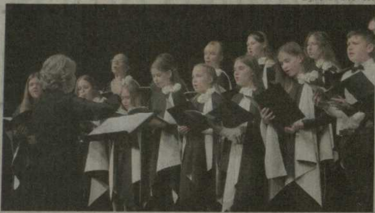
Kuršėnuose vyko XI regioninė chorinės muzikos šventė „Tegul dainoj ištirpsta toliai“.