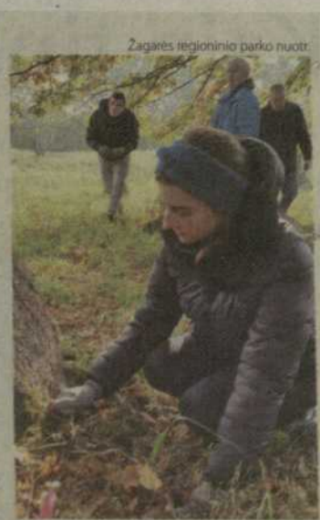
Siemet jau antrą kartą Naujosios Žagarės žydų kapinėse buvo dokumentuojami išlikę antkapiniai akmenys ir užrašai, kurie pateks į skaitmeninę duomenų bazę.

Daugyvenės kultūros istorijos muziejaus draustinio inf.