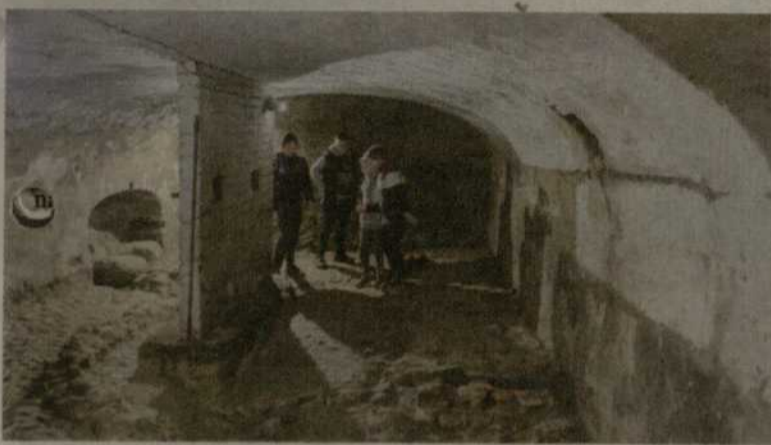
Pastato rūsyje archeologai atkasė grindinį.