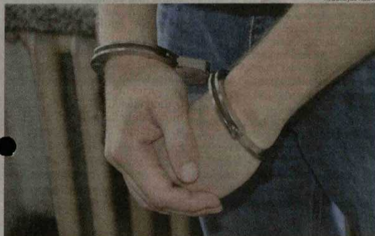
Už įvykdytus nusikaltimus laukia teismo nuosprendis, kaltinamasis jo laukia suimtas.

Sulaikius vyrą užsienyje paaiškėjo, kad jo ieško ir Lietuvos teisėsauga. Atlikęs bausmę už vagystę Didžiojoje Britanijoje, šių metų sausio pradžioje jis buvo pargabentas į Lietuvą ir dabar už grotų laukia teismo dėl giminėje padarytų nusikalstamų veikų.