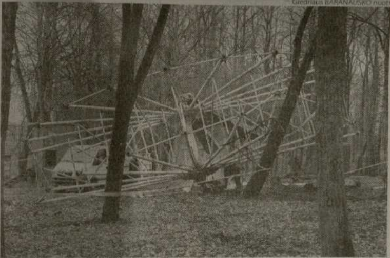
Centriniam parke baigiamas demontuoti apžvalgos ratas, kuris čia stovėjo apie šešis dešimtmečius.