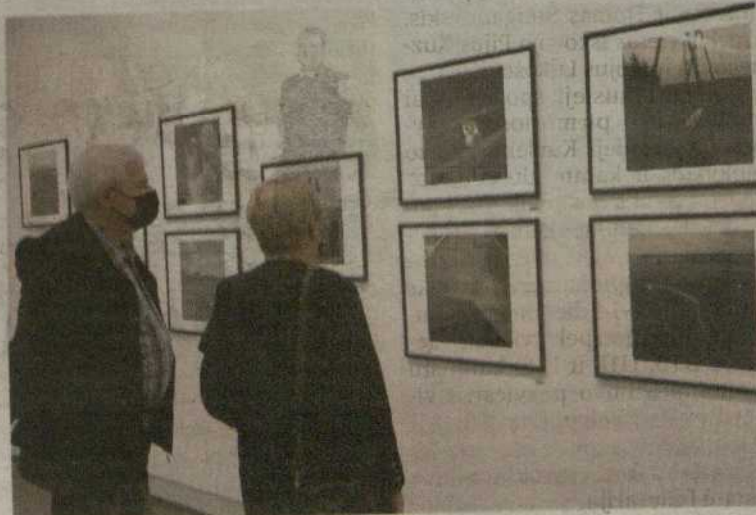
Aleksandro Ostašenkovo fotografijos kalba apie žmogaus egzistenciją, vidines būsenas.