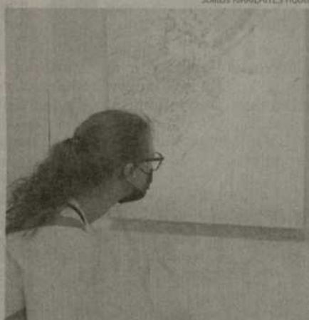
Parodoje eksponuojami darbai, sukurti taikant išskirtinę techniką – tapyti gėlėmis, iš jų išgaunant autentiškas spalvas ir raštus.

kitą laikmeną, mėgaujuosi procesu, naujais plastiniais ir spalviniais atradimais. Gėlės žydi trumpą laiką, mano kūrinuose jos lieka žydėti“, – apie kūrybą