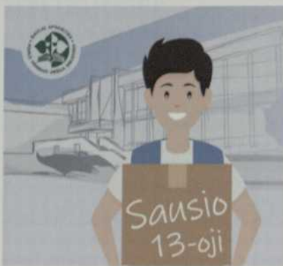
Laisvės gynėjų diena skirtas virtualus uždavinynas.

Virtualus istorijos uždavinynas. Šiaulių apskritys Povilo Višinskio viešoji biblioteka taip pat minėjo Sausio 13-osios, Laisvės gynėjų dienos, trisdešimtmetį. Paskelbto visuotinio karantino sąlygomis biblioteka, kaip ir daugelis kitų įstaigų, dalį savo veiklų perkėlė į virtualią erdvę. Todėl Kraštotyros, senųjų spaudinių ir skaitmeninio skyriaus parengė interaktyvų uždavinyną „Istorijos seklys: Sausio 13-osios relikvai“, skirtą šiai sukakčiai paminėti. Jame užduotys sudarytos taip, kad jas atliekant būtų galima palaipsniui išsiaiškinti teisingą atsakymą. Tai netradicinė priemonė istorijai mokytis ir istorinei atminčiai lavinti, ji patraukli įvairaus amžiaus ir skirtingų kompetencijų žmonėms. Šis „Google Forms“ platformoje sukurta edukacinis produktas sulaukė didesnės sėkmės, nei tikėjosi patys kūrėjai. Uždavinius sprendė daugiau nei pusseptinto tūkstančio dalyvių. Maloniai nustebino ir geografinė imtis. Užduotis bandyta įveikti ne tik didžiuosiuose Lietuvos miestuose (Vilniuje, Kaune, Klaipėdoje, Šiauliuose, Panevėžyje), bet ir mažesniuose – Biržuose, Gargžduose, Kelmėje, Mažeikiuose, Rokiškyje, Šakiuose, Tauragėje ir kt. Uždavinyno nuoroda pasidalijo net ir Vašingtono Kristijono Donelaičio lituanistinė mokykla bei lituanistinė mokykla „Gintarėlis“ Airijoje. P. Višinskio biblioteką pasiekė daug pozityvių pedagogų ir kolegų, dirbančių įvairiose kultūros ir atminties intucijose, atsiliepimų.