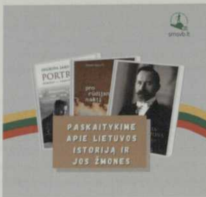
Biblioteka parengė rekomenduojamų knygų sąrašą.

Paminėta Vasario 16-oji. Šiais metais miesto savivaldybės viešoji biblioteka Šiaulių mokyklų mokinius ir darželinius pakvietė Vasario 16-ąją paminėti virtualiai. Mokiniai dalyvavo įvairiose su Lietuvos istorija susijusiose interaktyviose viktorinose, kurias bibliotekininkai rengė naudodamiesi „Zoom“ platforma. Vaikai pasitikrino savo žinias apie Lietuvos iškilias asmenybes, taip pat ežerus, pastatus, išmaniai atsakinėjo į klausimus apie valstybės herbą, vėlavą, atkreipė dėmesį į simbolių spalvas, himno žodžius. Prisiminė ir Šiaulių miesto herbą, Gedimainių stulpus, legendą apie Gedimino pilį. O darželinukai savo mintis apie Lietuvą perteikė spalvinguose piešiniuose. Mažieji šiauliečiai vaidavo Gedimino pilį,