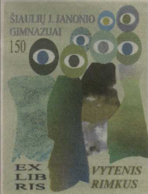
Alfonsas Čepauskas. 2001.