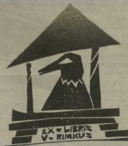
Stasė Medytė. 1990.