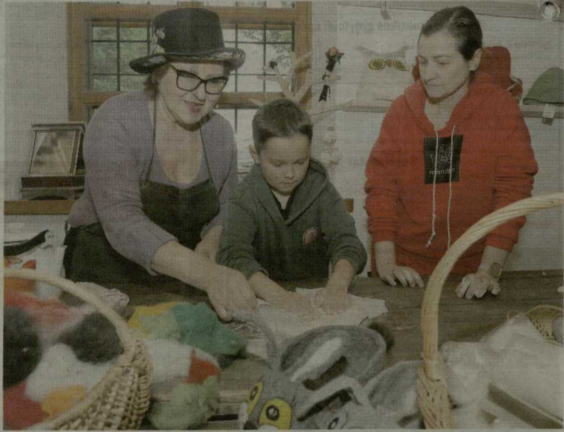
Vyksta edukacinis užsiėmimas.