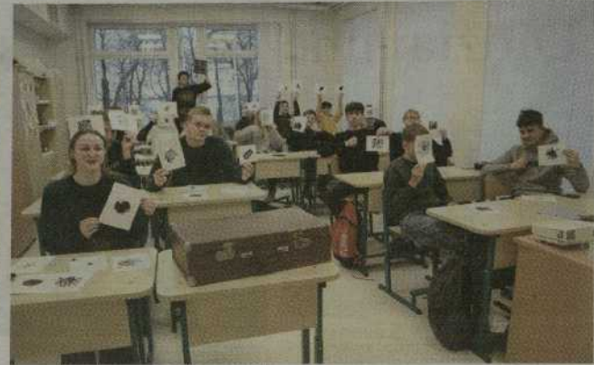
Jaunuoliai sukūrė gausybę knygos ženklų.

Projektu siekta sudominti ne tik meno mėgėjus, bet ir gimnazijų moksleivius.