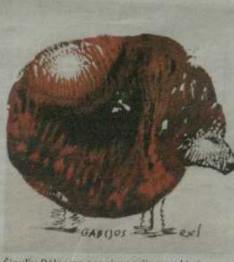
Šiaulių Rėkyvos progimnazijos mokinės sukurtas ekslibris.

Šiaulių Šantarių gimnazijos mokinės sukurtas ekslibris. Šiaulių Rėkyvos progimnazijos mokinės sukurtas ekslibris. Šiaulių Rėkyvos progimnazijos mokinės sukurtas ekslibris. Šiaulių Rėkyvos progimnazijos mokinės sukurtas ekslibris.