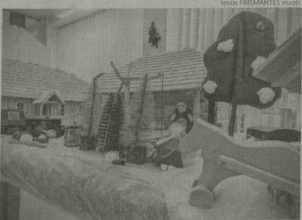
Šiaulių apskrities Povilo Višinskio viešosios bibliotekos Vaikų abonemente eksponuojamas etnosodžius.