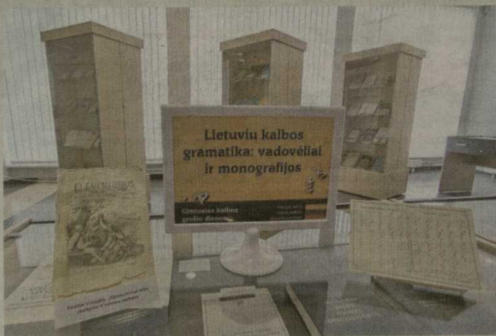
Šiaulių apskrities Povilo Višinskio viešojoje bibliotekoje veikia knygų paroda „Lietuvių kalbos gramatika: vadovėliai ir monografijos“, skirta Lietuvių kalbos dienoms paminėti.