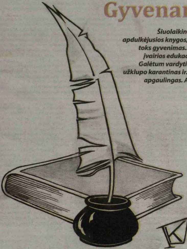
Kęstučio PABLIJUTO pieš.

Šiuolaikinė biblioteka jau seniai nebėra ta vieta, kurios lentynose ieškai apdulkėjusios knygos, susibruki krūvelę patikusių ir perskaitęs neši atgal. Čia verda toks gyvenimas... Kompiuterinio raštingumo kursai, užsienio kalbų mokymas, įvairios edukacijos, komiksų kūrimas, žaidimai ir pokalbiai šeimos erdvėse... Galėtum vardyti ir vardyti, ką siūlo šiuolaikiniai bibliotekininkai. Bet netikėtai užklupo karantinas ir... bibliotekose, kaip ir visur, įsivyravo tylą. Tačiau toks įspūdis apgaulingas. Apie naujas patirtis įspūdziais dalijasi Šiaulių bibliotekininkai.