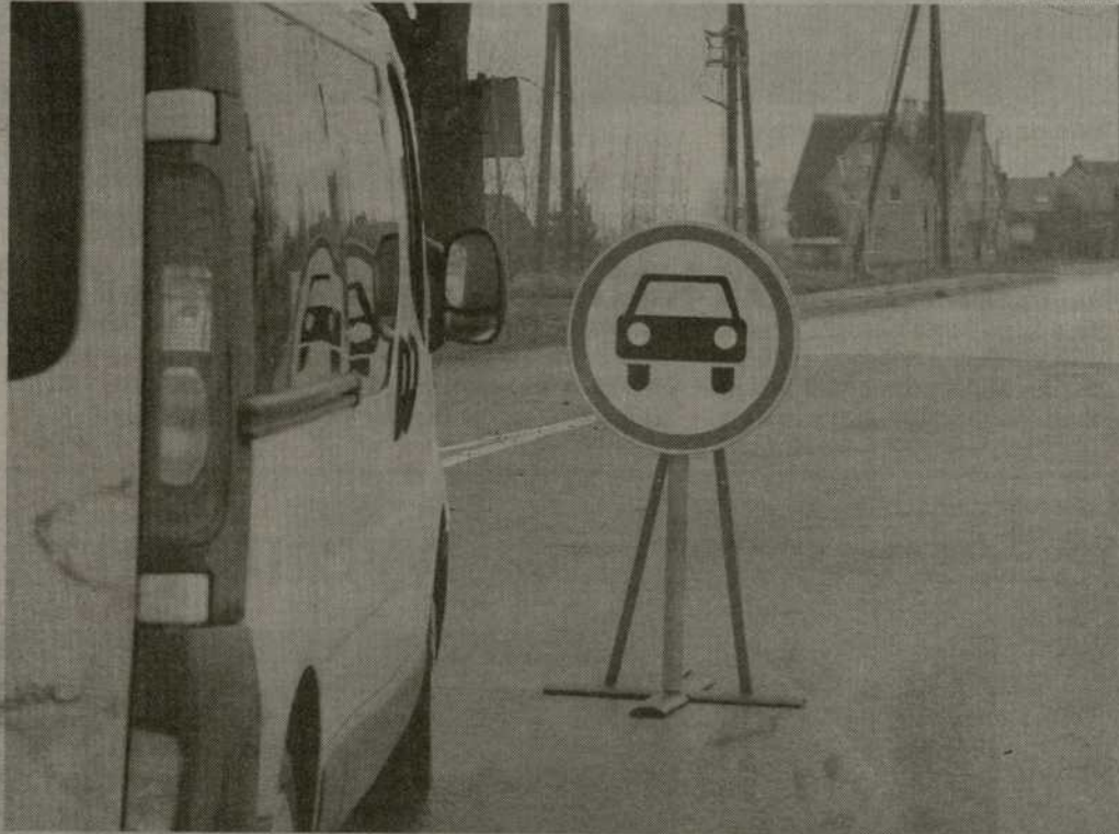
Kituose nedideliuose įvažiuimuose į Šiaulius pastatyti automobilių eismą draudžiantys ženklai.