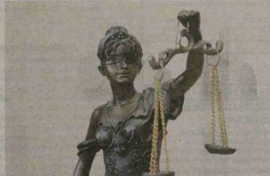
Teisinė sistema beveik dvejus metams išblaškė mamą ir du jos vaikus.

Moteris pasakojo, kad susitikimo metu berniukas teigė, jog ji ligoninėje muše sanitaras – sudavė j galvą, kaklą, vadino įvairiais žodžiais, o kad būtų ramesnis jam suleisdavo vaistų. Vaikas aiškino,