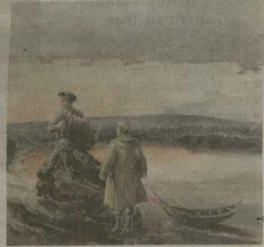
Počet (Krasnojarsko kraštas). Vakaras prie upės Birusa. Dešinėje Antanas Krištopaitis (autoportretas). Akvarelė. 29x27, 1954 m.