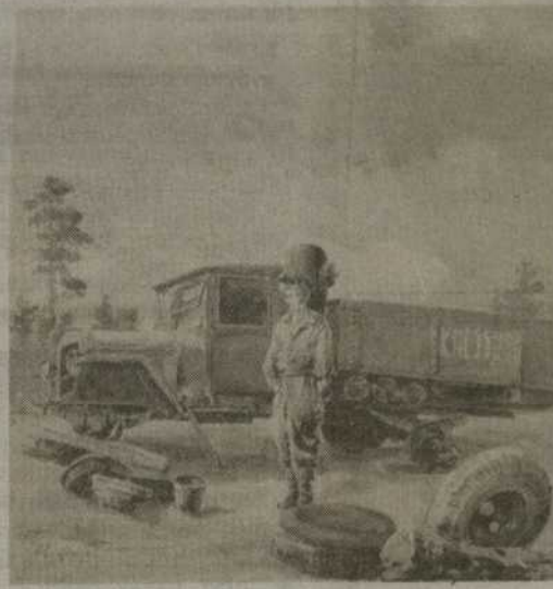
Krasnojarsko kraštas (Rusija). Automobilio remontas. Akvarelė. 28,5x26, 1953 m.