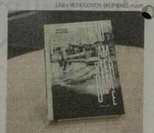
Knygoje „Lietus Amsterdame“ susipina tragiški Antrojo pasaulinio karo bei pokario metų įvykiai ir jų vertinimas šiais laikais.

Jaunas žurnalistas velionio tėvo albume aptinka nuotrauką iš Amsterdamo, kurioje užfiksotas žydų tautybės senelių kaimynas. Nutažęs išsiaiškinti tėvo ryšį su nufotografuotu asmeniu ir parašyti apie tai straipsnį, jis nuvyks-