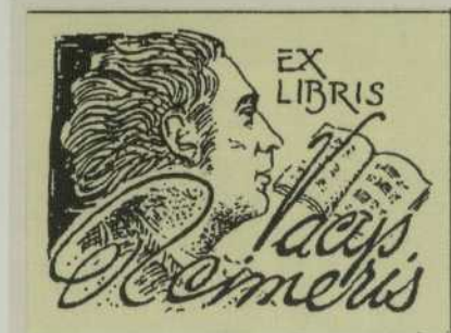
Šiaulių rajono bibliotekos Kuršėnų Vytauto Vitkausko bibliotekoje daugiausia knygų, paženklintų poetui ir vertėjui Vaciu Reimeriui skirtu ekslibrisu (autorius nežinomas).