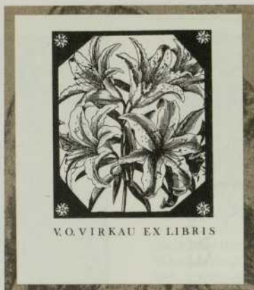
Vytauto Osvaldo Virkau autoekslibras. Iš Radviliškio rajono savivaldybės viešosios bibliotekos