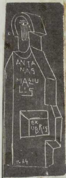
Vinco Kisarausko sukurtas ekslibrisas. Iš Šiaulių miesto savivaldybės viešosios bibliotekos

yra jo nepasitenkinimą knygos turiniu vaizduojantys knygos ženklai.