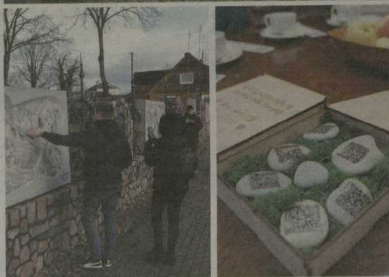
Maršruto pristatymo akimirka Akmenės mieste.

lankomą objektą išgirsti, o ne perskaityti. Taip pat visų objektų aprašai išversti į anglų ir latvių kalbas, todėl maršrutus gali lankyti kitų šalių svečiai.