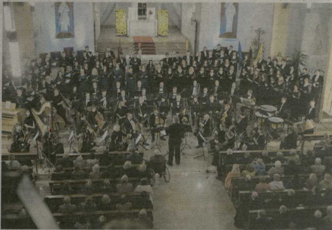
Sekmadienį Šiaulių Švč. Mergelės Marijos Nekaltojo Prasidėjimo bažnyčioje baigėsi visą velykinę savaitę trukęs 40-asis festivalis „Resurrexit“.