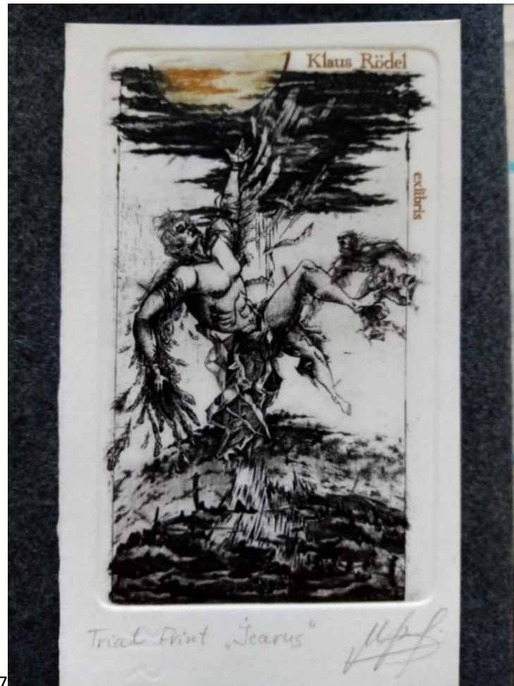
Fecit Mariana Myroshnychenko – Ikarus