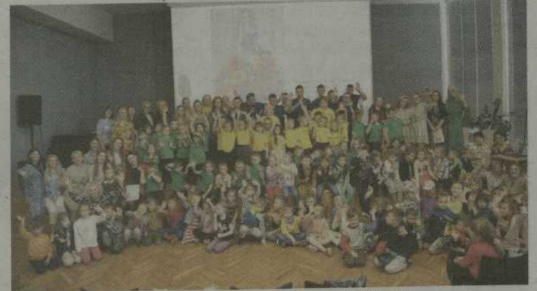
Bibliotekoje vyko fotografijų parodos „Mamos suknelė“ atidarymas ir koncertas, skirtas Motinos dienai paminėti.

Parodos „Mamos suknelė“ atidarymo proga koncertavo Šiaulių lopšelio-darželio „Ažuoliukas“, Akmenės rajono Ventos lopšelio-