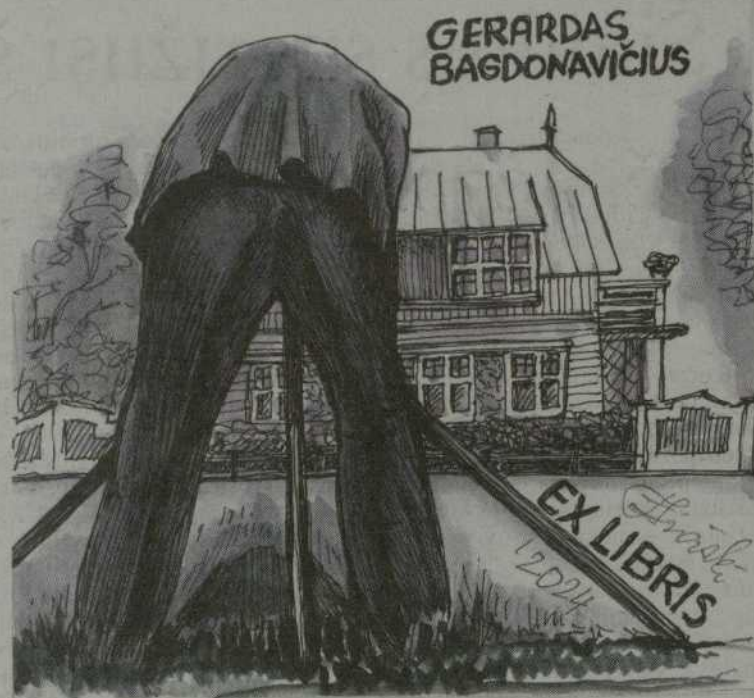
Aldonos Traškinienės ekslibrisas.

Projektą „Dvidešimt penktoji Lietuvos ekslibriso paroda“ finansuoja Lietuvos kultūros taryba ir Šiaulių miesto savivaldybė.