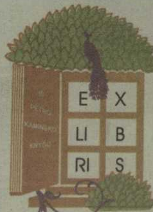
Aut. Vaidotas Janulis.