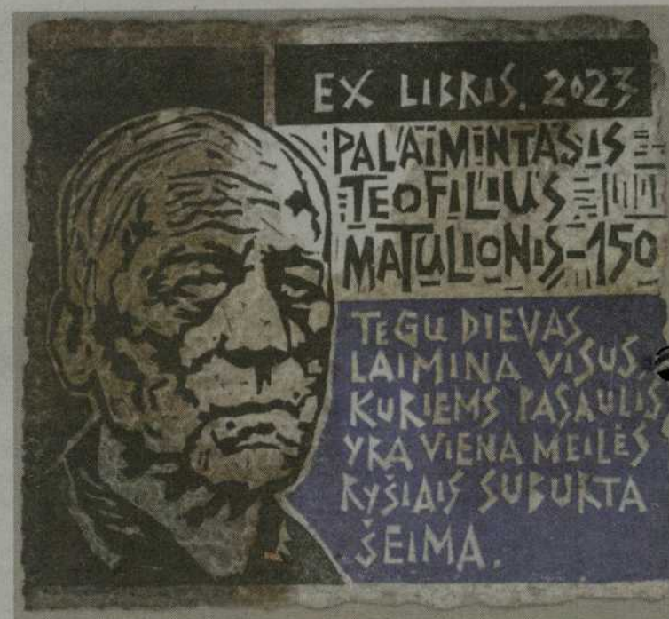
Aut. Sigutė Bronickienė.