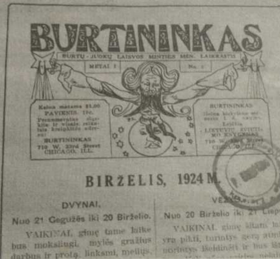
Čikagoje lietuvių leisto burtų juokų laisvos minties mėnesinio laikraščio „Burtininkas“ 1924 metų birželio numeris.