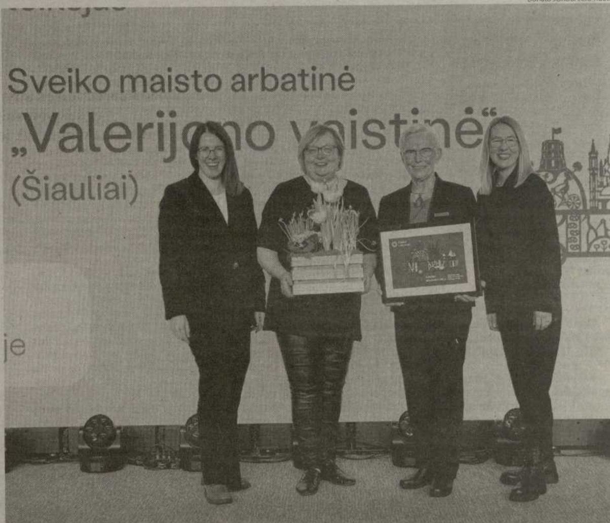
Parengta pagal „Valerijono“ inf.

Tradiciniai „Turizmo sėkmingiausiųjų“ rinkimai surengti jau devynioliktą kartą. Dėl apdovanojimų varžėsi 27 nominantai, į kvietimą balsuoti internetu atsiliepė daugiau kaip 27 tūkstančiai žmonių.