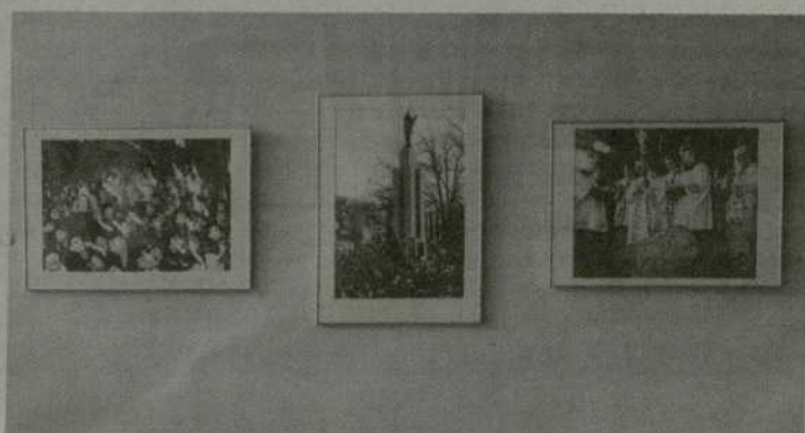
Nuotraukos primena kelią į Nepriklausomybę.