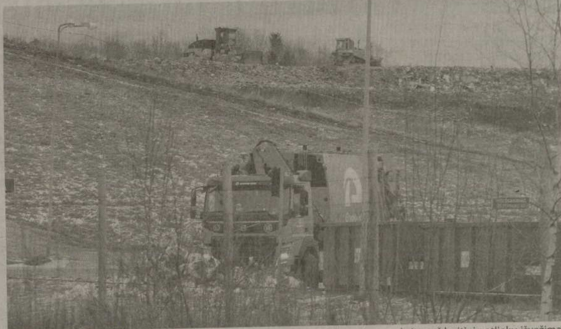
Šiaulių regiono atliekų tvarkymo centras jau pateikė popierines ir elektronines sąskaitas už buitinių atliekų išvežimą.